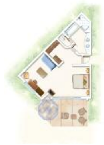
Suite Junior Junior Suite