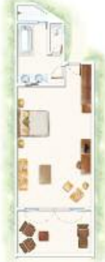
Chambre Deluxe Deluxe Room