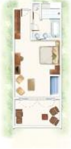
Chambre Supérieure Superior Room